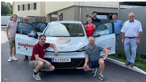
Wartberg an der Krems