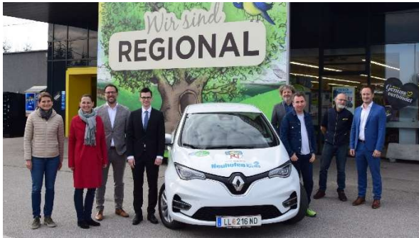
Neuhofen an der Krems

Beispiel: 5 neue FAMILY e-Carsharing Standorte in OÖ im Jahr 2022